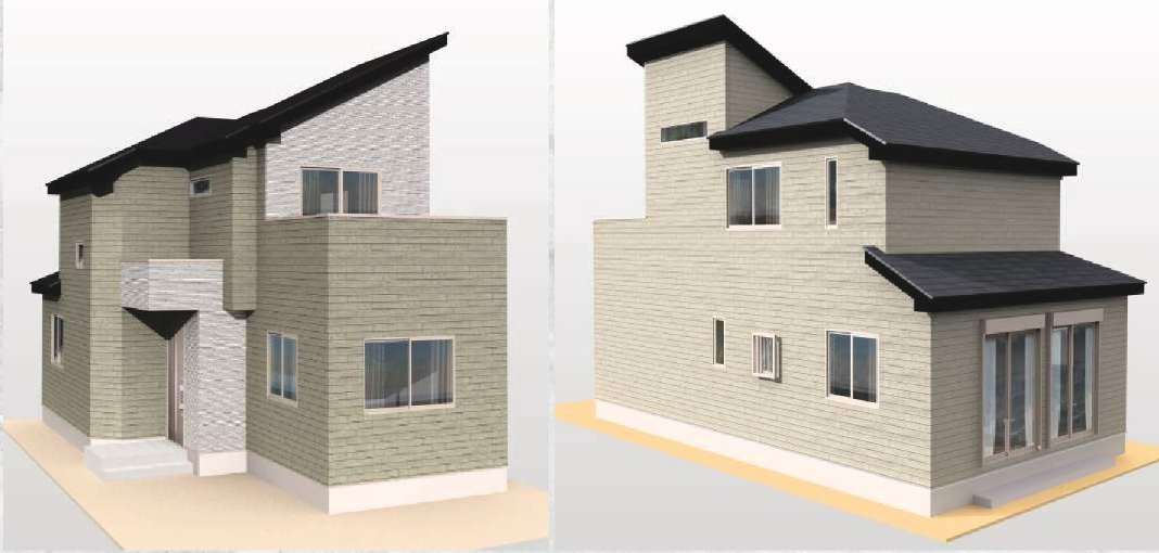
※図面を基に描き起こしたものであり、実際とは変更になる場合がございます。