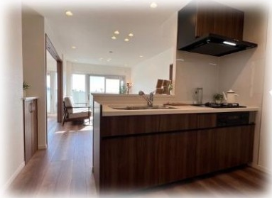
【システムキッチン】